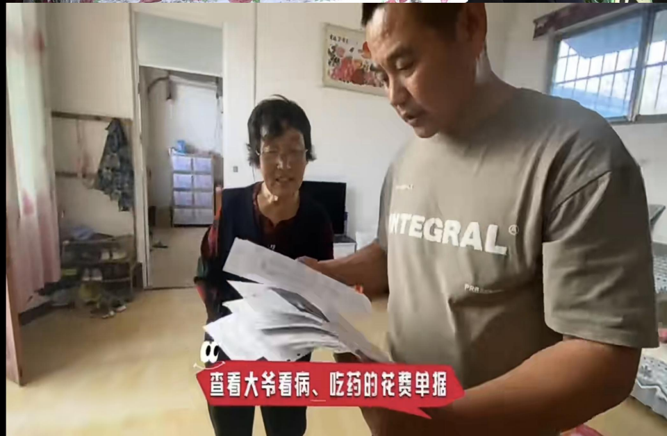
查看大爷看病、吃药的花费单据