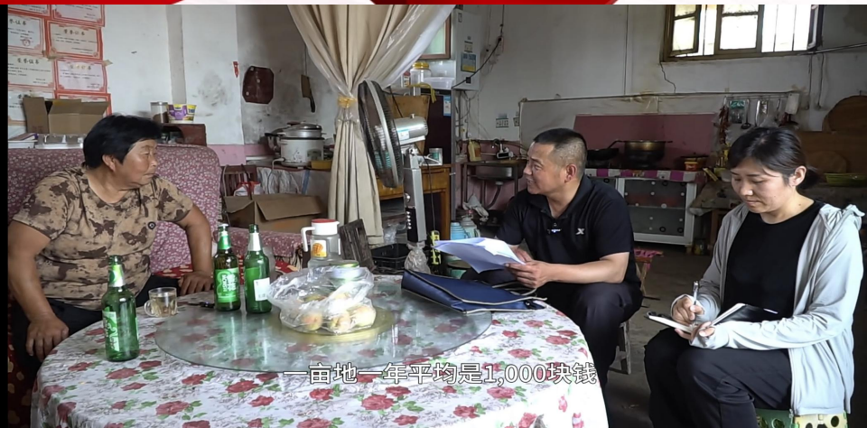
亩地一年平均是1,000块钱

群众在了解政策时，多数人存在对政策性文件看不懂的困惑，导致救助政策知晓率比较低，许多困难群众无法及时得到救助。